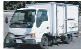
医療廃棄物回収車